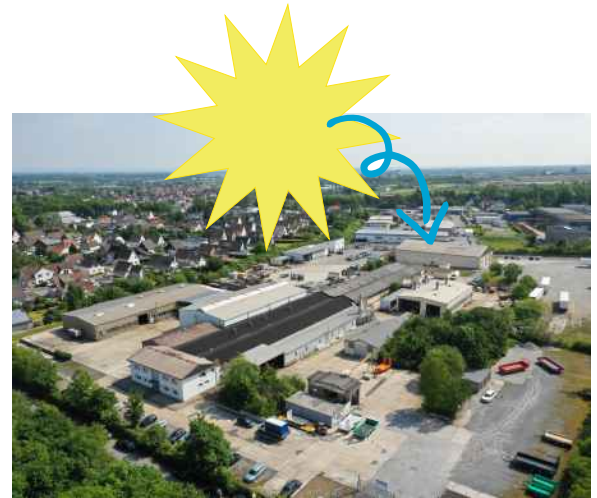
Das Geseker Betriebsgelände von oben: im November 2022 wird eine weitere 100kWp Photovoltaikanlage auf die Dächer der Fertigungshallen gebracht.

Im Jahr 2023 feiert unsere Firma 60jähriges Betriebsjubiläum - laut KBA-Bestandstatistik sind ca. 60% aller Blumenröhr-Anhänger, die jemals in Deutschland in den Straßenverkehr gebracht worden sind, noch zugelassen. Das bedeutet, dass viele auch schon 30 Jahre oder ältere Fahrzeuge immer noch ihren Dienst tun! Welches Nutzfahrzeug kann das von sich behaupten? Ein echter Hinweis auf nachhaltige, langlebige Produkte!